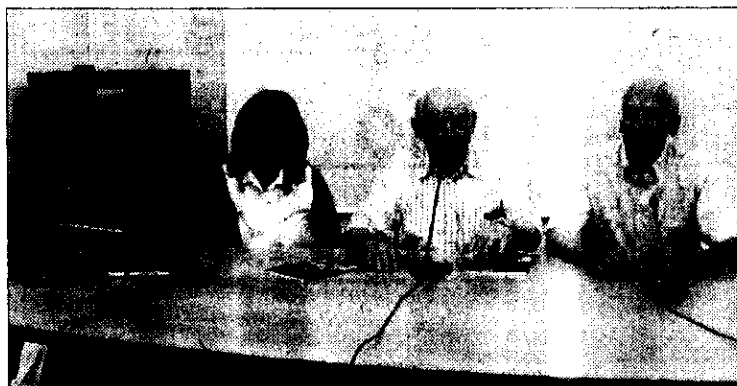
La presentazione della mostra che si terrà a Rivergaro