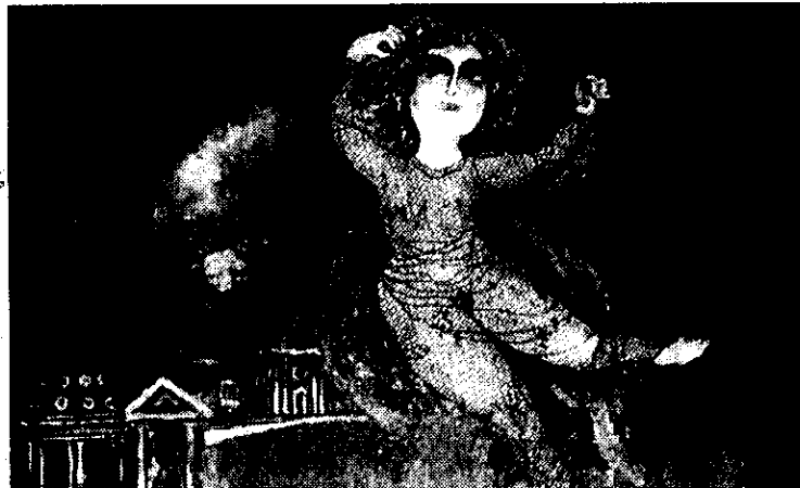
Sopra, da sinistra "Autoritratto" di Arrigoni e "Ballarina" di Spazzali